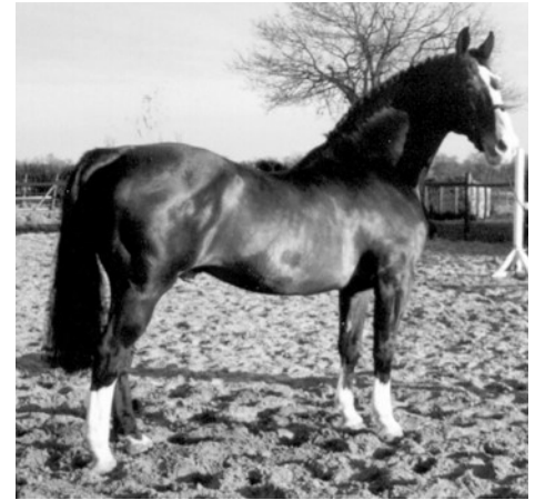
Akteur, hier 25 jaar oud, ondanks veel prestaties toch op hoge leeftijd kernegezond.

Creool is de enige goedgekeurde hengst van Akteur. Hij heeft jarenlang op internationaal niveau in de springsport gepresteerd en won in 2001 de VHO-trofee vóór alle andere Nederlandse dekhengsten. Ook in andere opzichten is er veel overeenkomst met zijn vader, zoals gezondheid, goed karakter en te weinig waardering bij de fokkers.