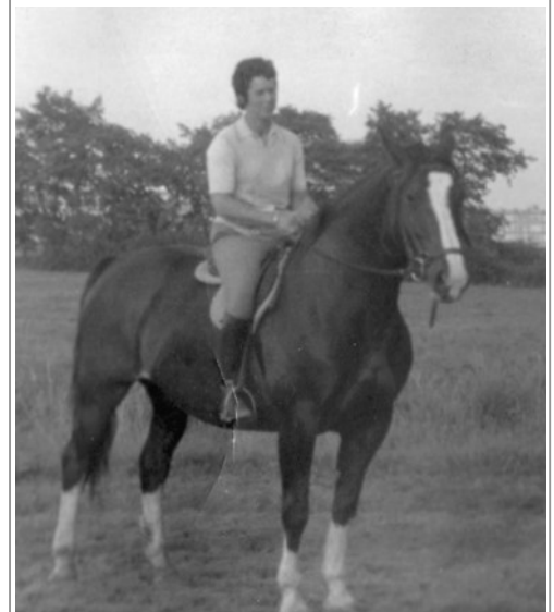
De modelmerrie Jonkvrouw, braaf karakter en grote werklust.