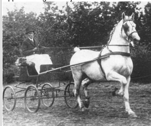
De hengst Tello (1927 – 1954) gaf naast gezondheid aan al zijn kinderen de schimmelkleur door.