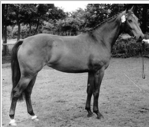
Carelda keur-preferent-prestatie (1984 – heden), Z-dressuur en Z-springen, dochter van Akteur uit een halfbloed-merrie.

Dat de afkeuring van Akteur in 1983 geen toevallig incident was blijkt uit het resultaat van zijn kleinzoon Aktion een half jaar eerder als veulen op de KWPN-premiekeuring. Het publiek applaudiseerde omdat dit veulen zo schitterend door de baan ging. Toch eindigde Aktion helemaal achteraan met een derde premie, want op zo'n zwaar paard kon je toch niet rijden. Verontwaardigd heeft Ridder met zijn veulen niet deelgenomen aan de ereronde, maar demonstratief in de andere richting de baan verlaten. Het is aan zijn eigen wijsheid te danken, dat hij zich van het oordeel van de KWPN-jury niets heeft aangetrokken en Aktion niet heeft gecasteerd maar heeft opgefokt voor dekhengst. Bij het afscheid van Aktion uit de sport in 2000 tijdens de