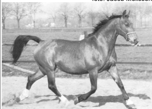
Ohnegleichen keur-preferent-prestatie (1973 – heden), moeder van de dressuurhengst Aktion, dochter van Akteur uit een klassieke merrie. Op deze foto 21 jaar oud.