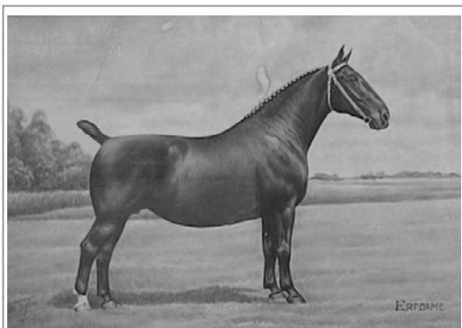
De modelmerrie Erfdame. Potloodtekening - met lichte waterschade - uit de oorlogsjaren, gemaakt door de in zijn tijd bekendste paardenfotograaf T. Melissen, vader van de hippisch fotograaf en journalist Jacob Melissen.